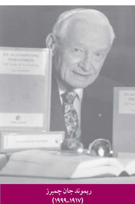
(۱۹۱۷–۱۹۹۹) اندیشمند بزرگ قرن بیستم و پیشرو در حسابداری ارزشهای جاری

چمبرز طی حدود ۲ دهه مقالات و تالیفات زیادی داشته است. اولین کتاب او در ۱۹۴۷ منتشر شد و به دنبال آن صدها مقاله در